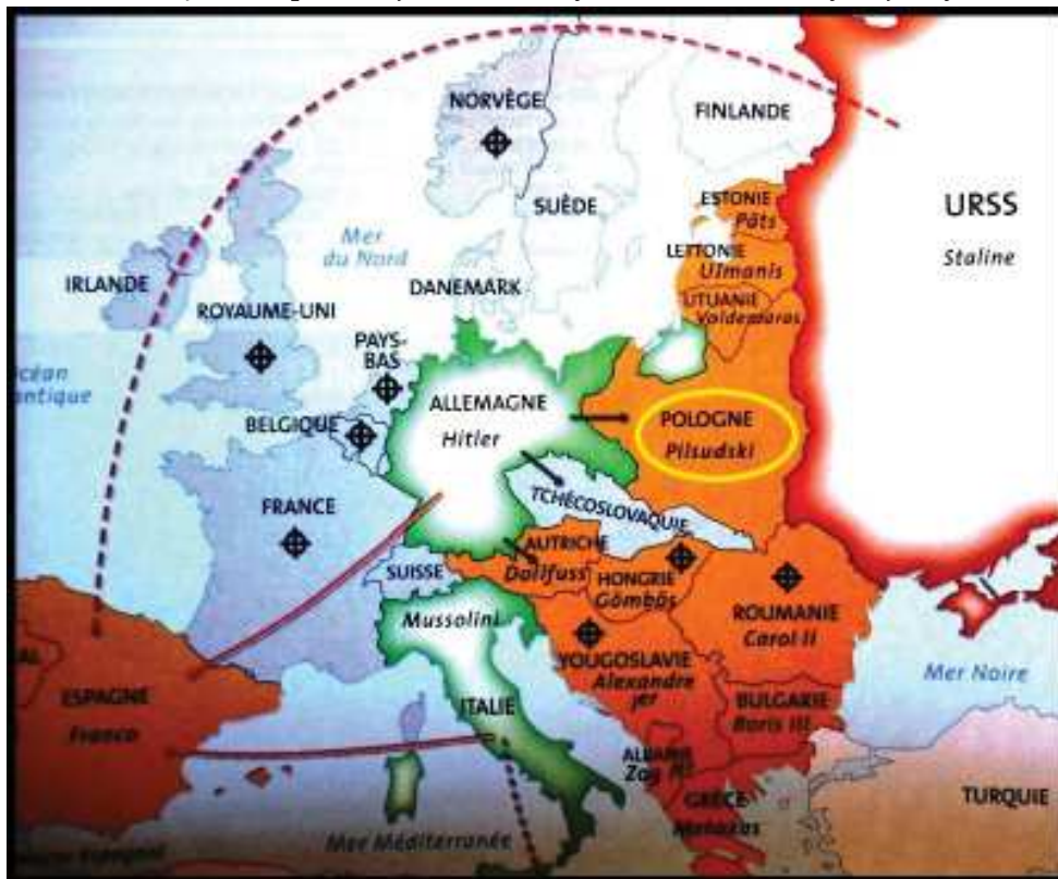
Ilustracja 4. Mapa ustrojów totalitarnych w latach międzywojennych

Źródło: podręcznik Adoumié V. (red.) Histoire T , [Historia klasa T], Hachette, Paryż 2012, s. 206.