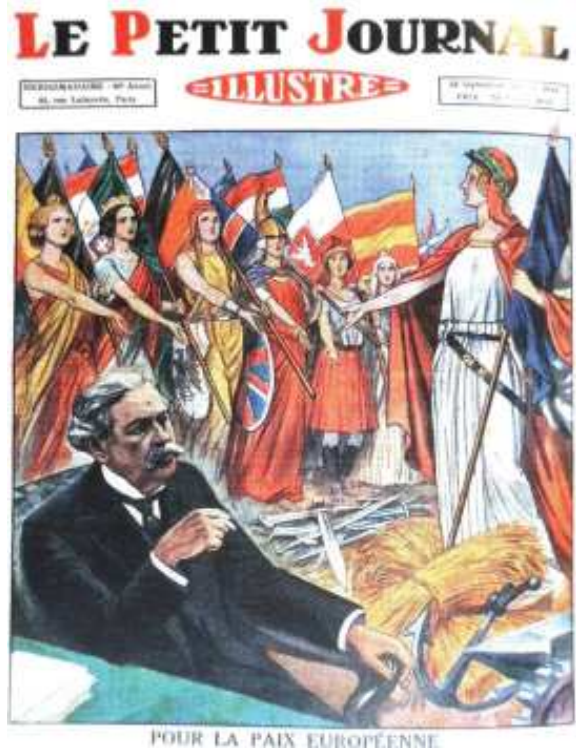
Ilustracja 3. Dla pokoju w Europie, „Le petit journal illustré”, 22.09.1929