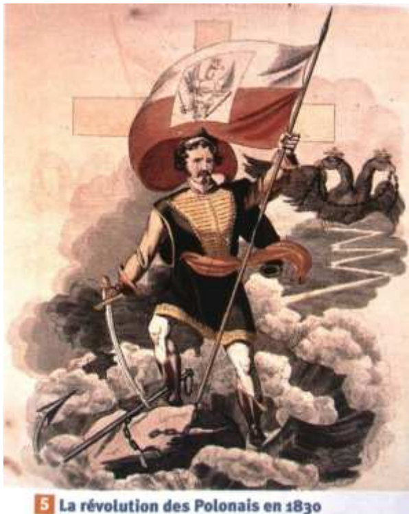
Ilustracja 2. Rewolucja Polaków w 1830 r.

5 La révolution des Polonais en 1830