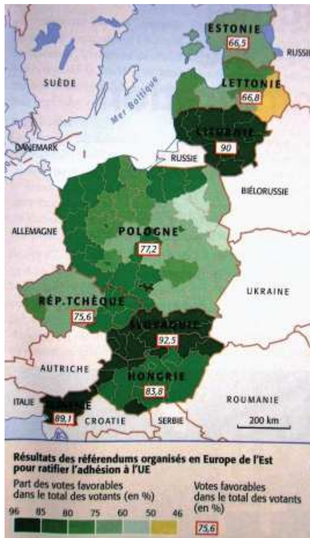
Ilustracja 5. Wyniki referendum akcesyjnego w Europie Centralnej