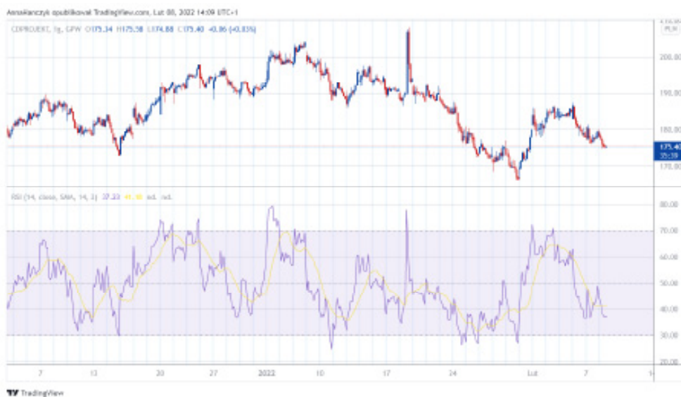
Rysunek 4 Relative Strenght Index RSI

Na przykładzie Relative Strenght Index (RSI) można w prosty sposób zobrazować, jak narzędzia analizy technicznej umożliwiają potwierdzenie decyzji inwestycyjnych. RSI to wskaźnik bazujący na wykresie cenowym, składający się z wykresu liniowego często przecinanego średnią kroczącą oraz wyznaczonych czterech poziomów oznaczonych 0, 30, 70, 100. Sygnał na poziomie 30 świadczy o wyprzedaniu rynku, więc im niżej tego poziomu znajduje się wskaźnik, tym większe prawdopodobieństwo na skuteczne zawarcie transakcji kupna. RSI na poziomie bliskim 0 świadczy, że trend spadkowy może niebawem przejść w trend zwyżkowy. Adekwatnie wygląda sytuacja z poziomem 70, który informuje o wykupieniu rynku oraz sygnalizuje, że inwestorzy powinni rozważyć sprzedaż akcji. Jeśli wykres zbliża się do poziomu 100 należy spodziewać się odwrócenia trendu zwyżkowego na spadkowy. W przypadku RSI ważne jest, by uważać na konsolidację. Oczywiście sygnałów generowanych przez wskaźniki czy oscylatory nie powinno się traktować jako zachętę do podejmowania jakichkolwiek działań inwestycyjnych, jednakże zawsze warto wziąć pod uwagę dane, które prezentują, ponieważ często mogą pomóc w weryfikacji stanowiska inwestora względem kursu.